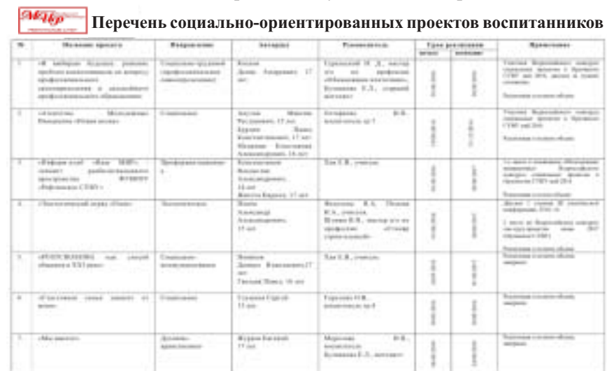
Фрагмент электронной базы данных «Копилка идей» социальных проектов обучающихся Рефтинского СУВУ